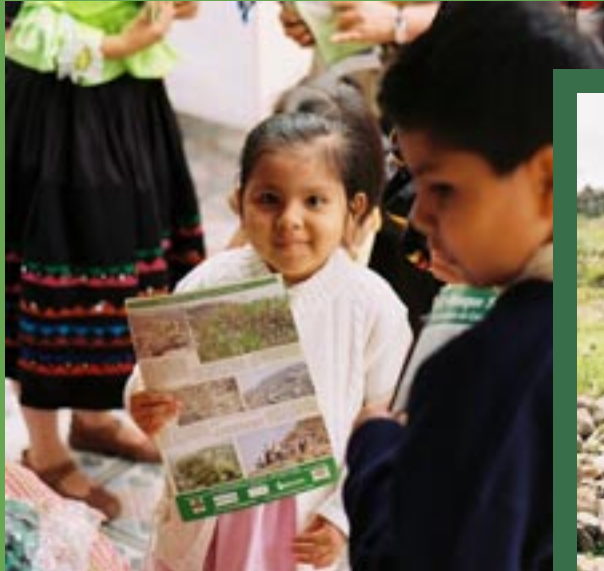
Un niña esta muy emocionada con su ficha sobre el medio ambiente en Sucre, Bolivia