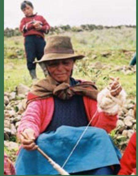
Un mujer esta hilando en Huayanay, Peru