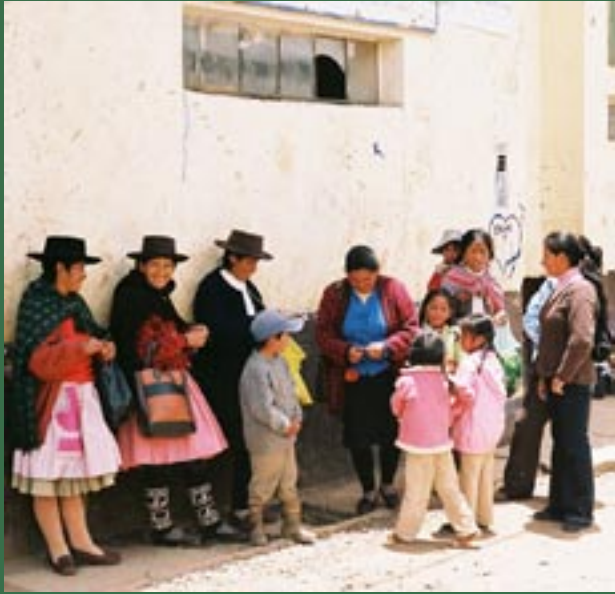
Ya luchando: Miembros de El Mucurio tejen

En este contexto global donde prima el egoísmo e individualismo, donde se está perdiendo los valores y prima los aspectos materiales; aun en este contexto hay muchas esperanzas de que podemos tener un mundo más justo y solidario.